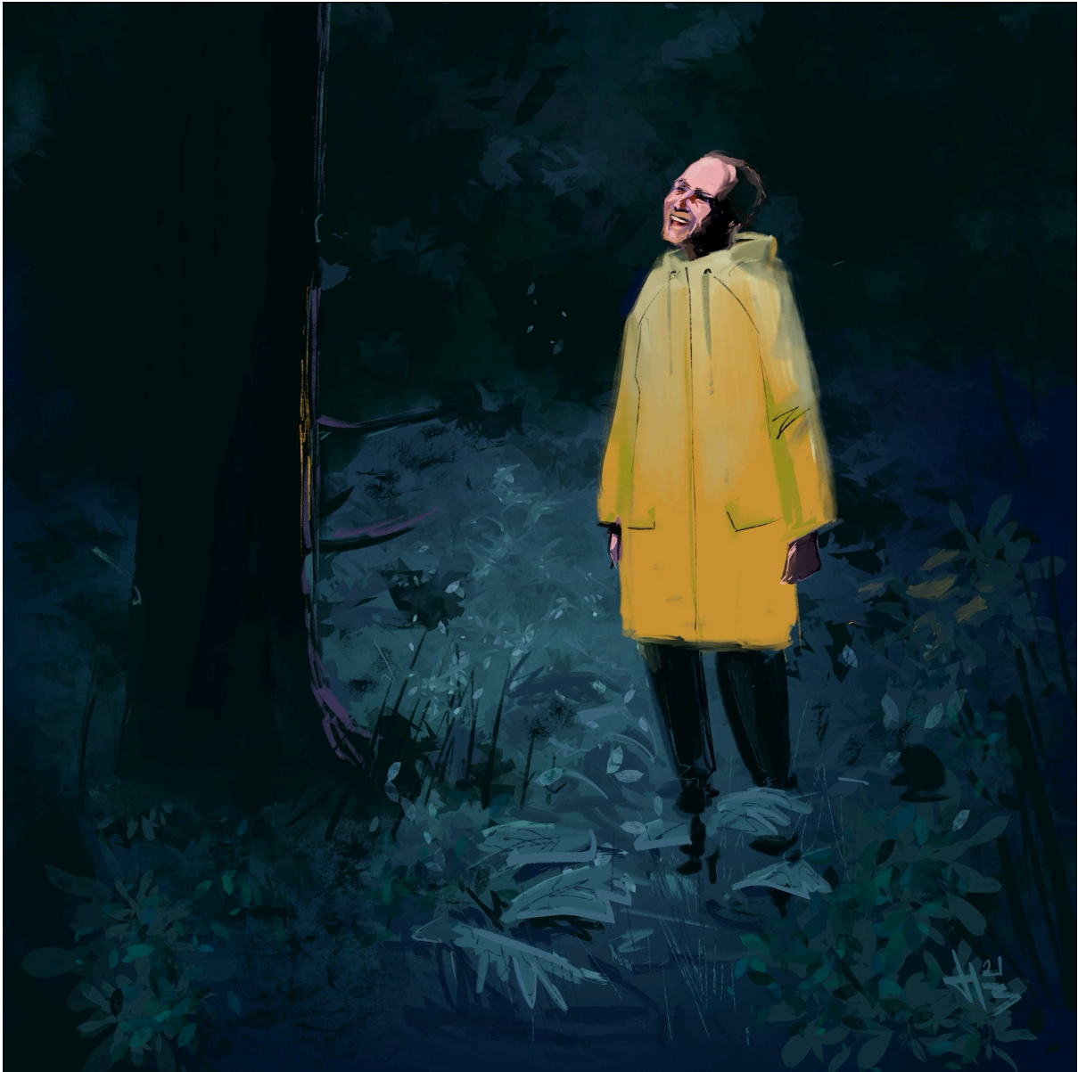
De verwondering- Artwork door Hilbrand Bos

'You Gave Me A Mountain' verschenen in 2023 op LP geperst door Deep Grooves.